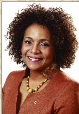
Michaëlle Jean Secrétaire générale de la Francophonie, 27e Gouverneure générale du Canada (2005-2010)